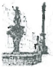
Rynek Fontanna z Neptunem