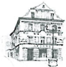
Kamera - Pód Bykara